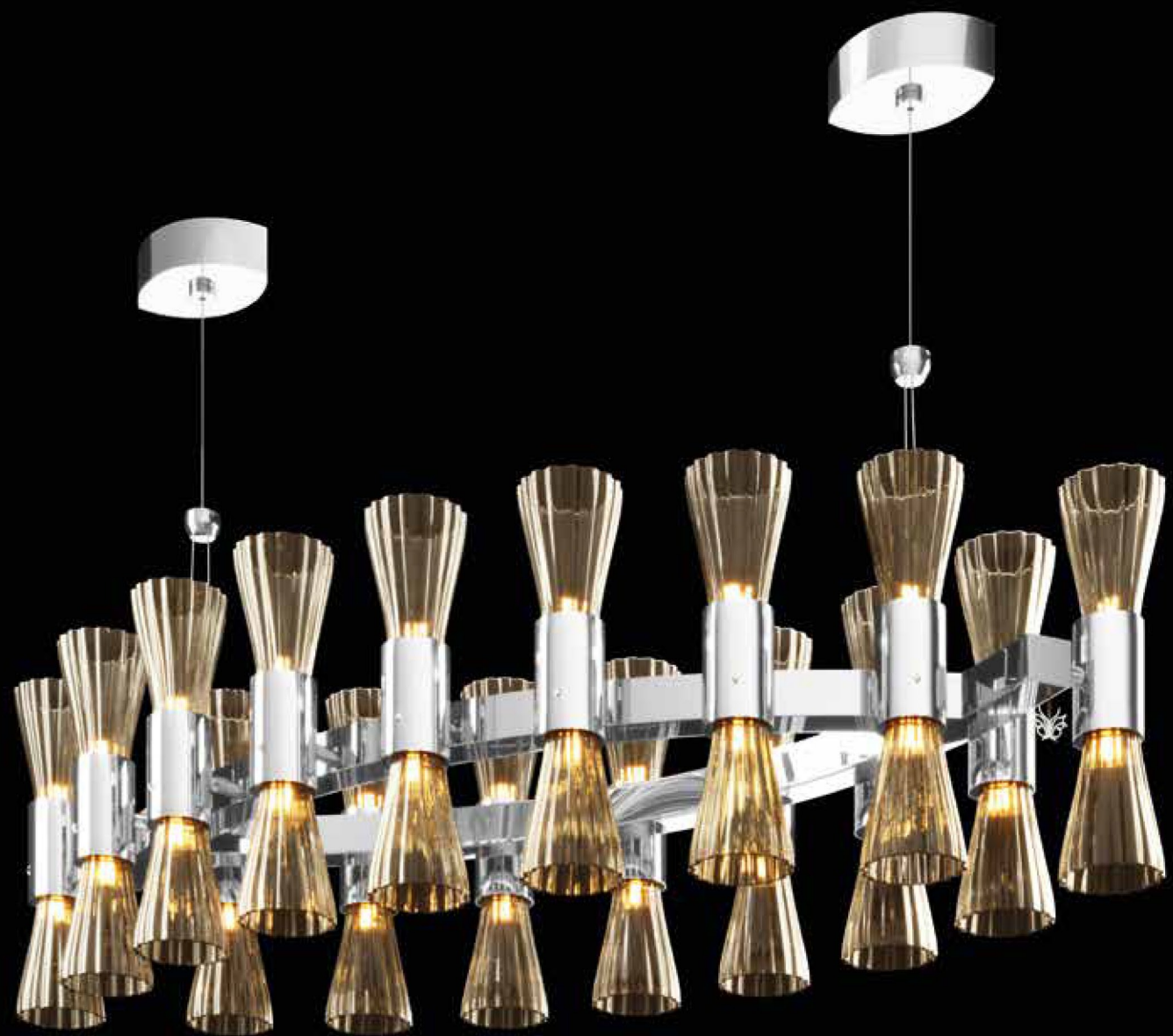
0650B08 160 x 65 cm - H. 44 cm - 16+16 x G9 MAX 25W