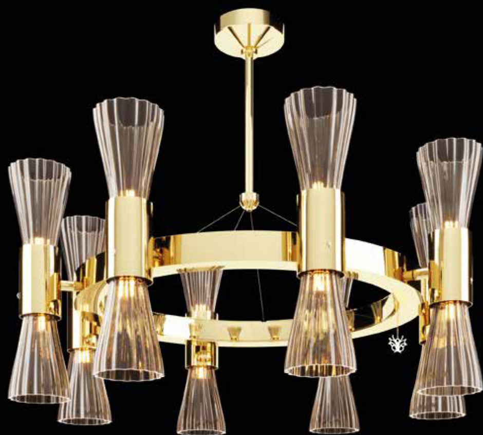
0650B03 - D. 100 cm - H. 80 cm - 8+8 x G9 MAX 25W