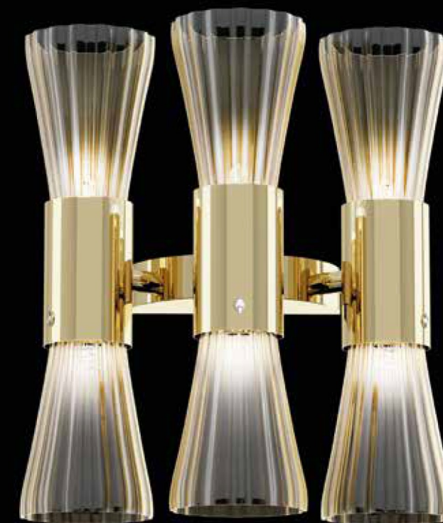
0650A02 - 35 x 25 cm - H. 45 cm - 3+3 x G9 MAX 25W