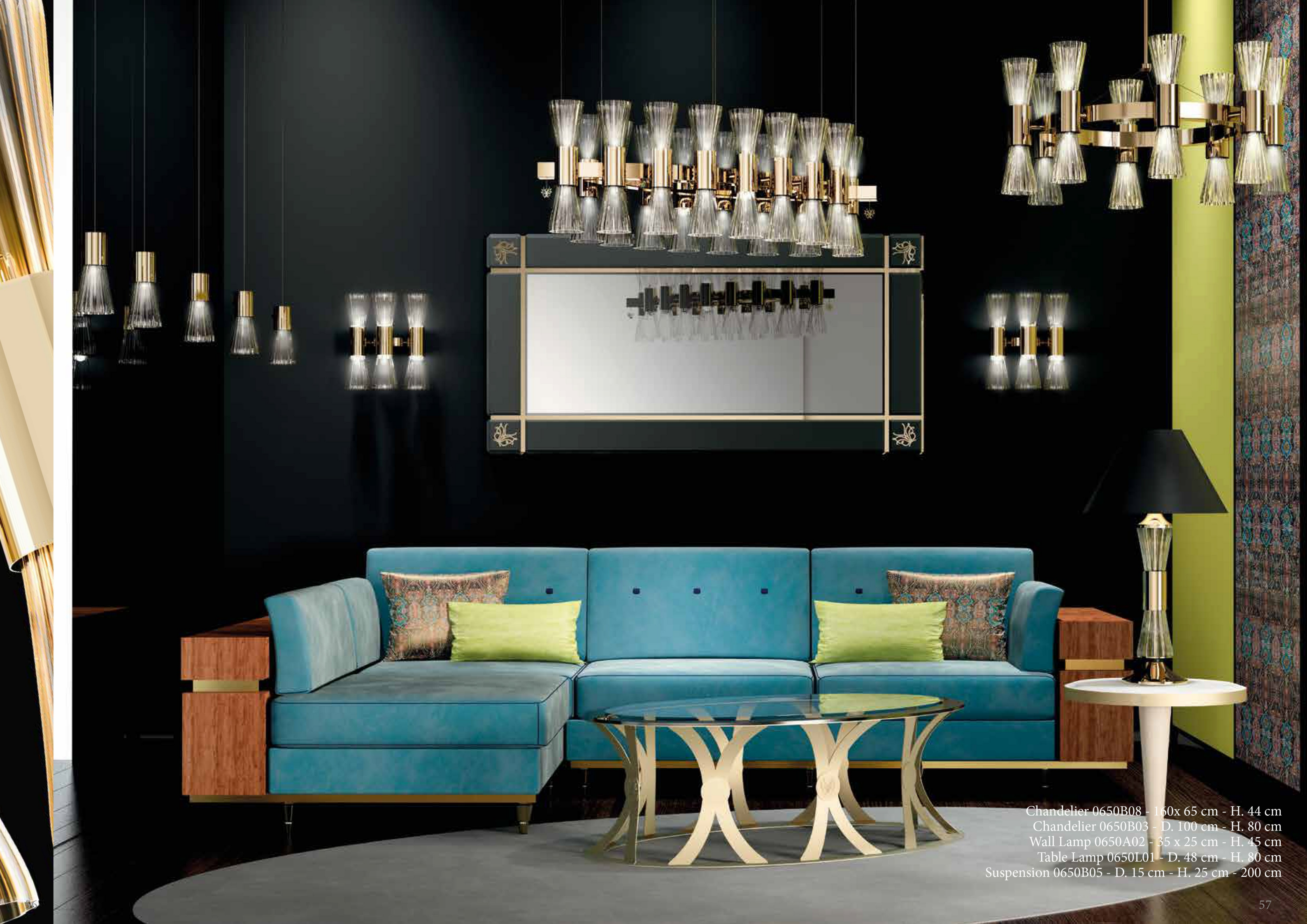
Chandelier 0650B08 - 160x 65 cm - H. 44 cm Chandelier 0650B03 - D. 100 cm - H. 80 cm Wall Lamp 0650A02 - 35 x 25 cm - H. 45 cm Table Lamp 0650L01 - D. 48 cm - H. 80 cm Suspension 0650B05 - D. 15 cm - H. 25 cm - 200 cm