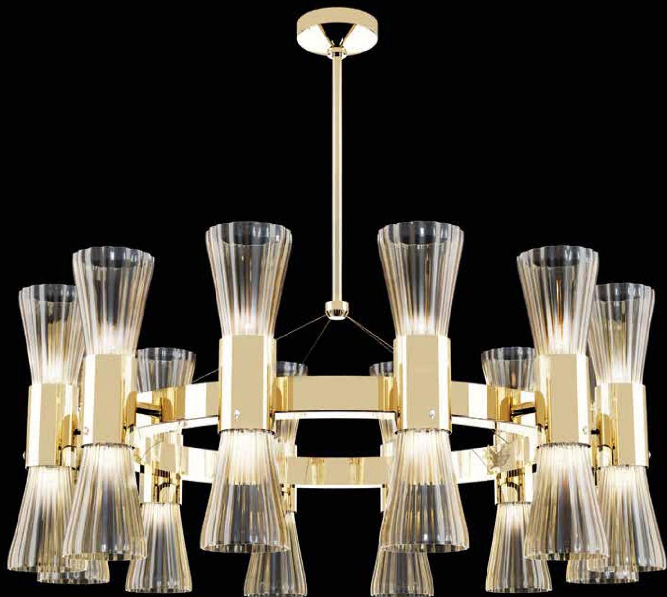
0650B01 - D. 110 cm - H. 95 cm - 12+12 x G9 MAX 25W